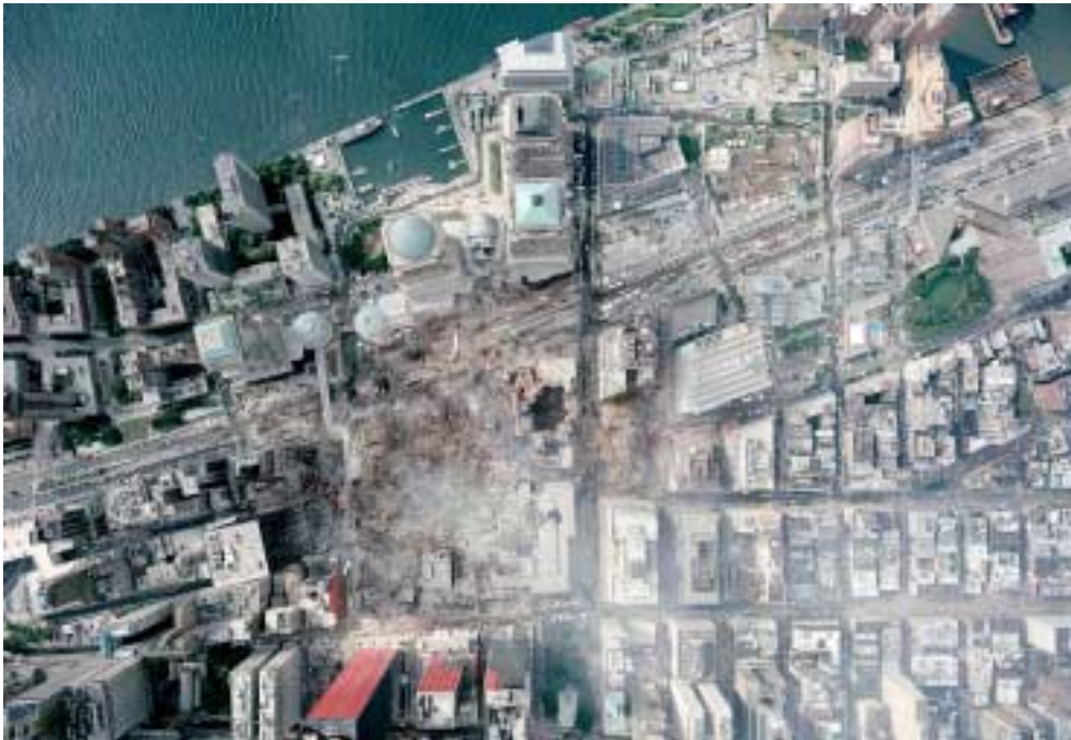
ニューヨークの悪夢

E-mail : tsuruwa@mxq.mesh.ne.jp 関東支部ホームページ : http://www2u.biglobe.ne.jp/~tsuruwa/kantosisbu.htm