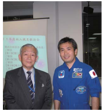
野口宇宙飛行士、若田宇宙飛行士とともに。土佐の若手にも、どこまでも羽ばたいてほしい。