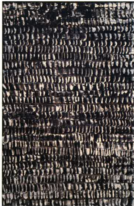
《モダンジャズ》1962年 高知県立美術館蔵