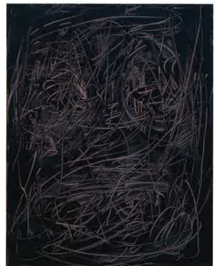
《作品》1961年 高知県立美術館蔵